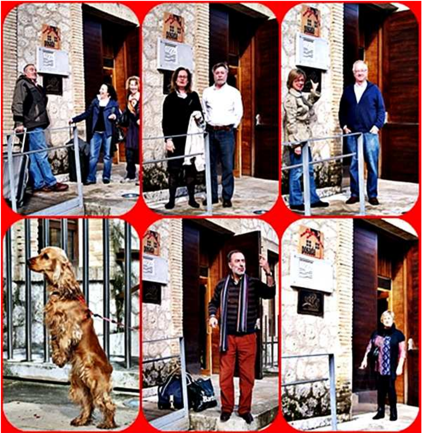
Molino de la Aceña * 04-2010jb Quintanilla de Onésimo (Valladolid)