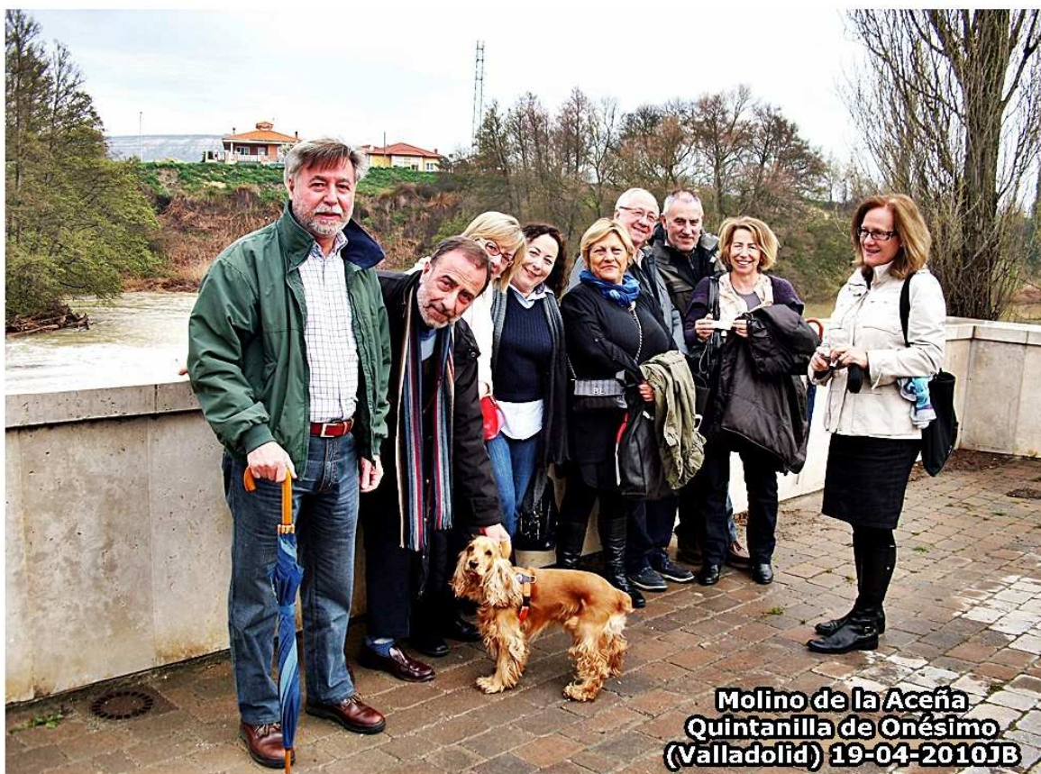
Molino de la Aceña Quintanilla de Onésimo (Valladolid) 19-04-2010JB